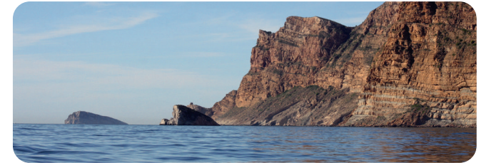
Illes de Benidorm i Mitjana i penya-segats de Serra Gelada - Islas de Benidorm y Mitjana y acantilados de Serra Gelada - Benidorm and Mitjana islands and Serra Gelada cliffs

The sea area contains important meadows of Posidonia oceanica , with a conservation status considered to be optimum on a general scale. In addition, in its clear waters we can find numerous species highlighted by their importance or conservation status, such as the Bottlenose dolphin or the Noble pen shell that is threatened, as well as numerous other species of fish, crustaceans and invertebrates that usually link their economic value with their environmental value due to being a fishing resource.