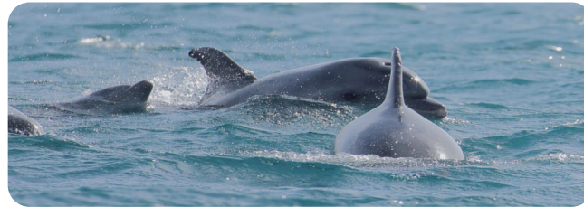
Grup familiar de Dofí mular - Grupo familiar de Delfín mular - Family group of Bottlenose dolphin

El área marina contiene importantes praderas de Posidonia oceanica , con un estado de conservación considerado óptimo a escala general. Además, en sus aguas podemos encontrar numerosas especies destacadas por su importancia o estado de conservación, como el Delfín mular o la amenazada Nacra, así como numerosas especies de otros peces, crustáceos e invertebrados que generalmente a su valor ambiental se le añade su valor económico al ser un recurso pesquero.