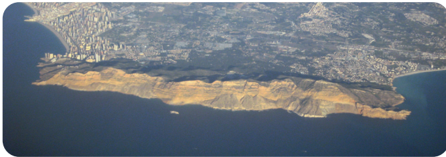
Serra Gelada i l'Illa Mitjana - Serra Gelada y la isla Mitjana - Serra Gelada and Mitjana island

L'àrea marina conté importants praderies de Posidonia oceànica (alguers) en un estat de conservació considerat òptim a escala general. A més, en les seues aigües podem trobar moltes espècies destacades per la seua importància o estat de conservació, com el Dofí mular o l'amençada Nacra, així com nombroses espècies d'altres peixos, crustacis i invertebrats al valor ambiental dels quals s'afeg, generalment, el seu valor econòmic pel fet que són un recurs pesquer.